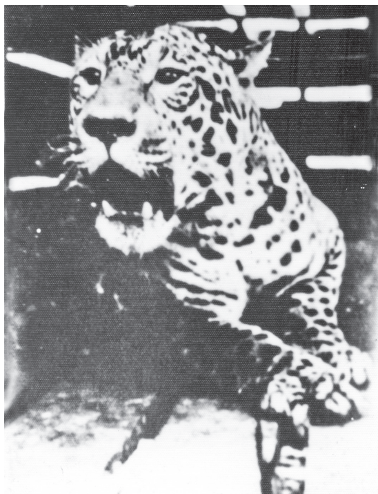
Figura 2 - “La tighera” capturada na propriedade da família Vendrami

Fonte: Cani, Iracema Maria Moser. Rodeio: histórias e memórias . Indaial: Uniasselvi, 2011.