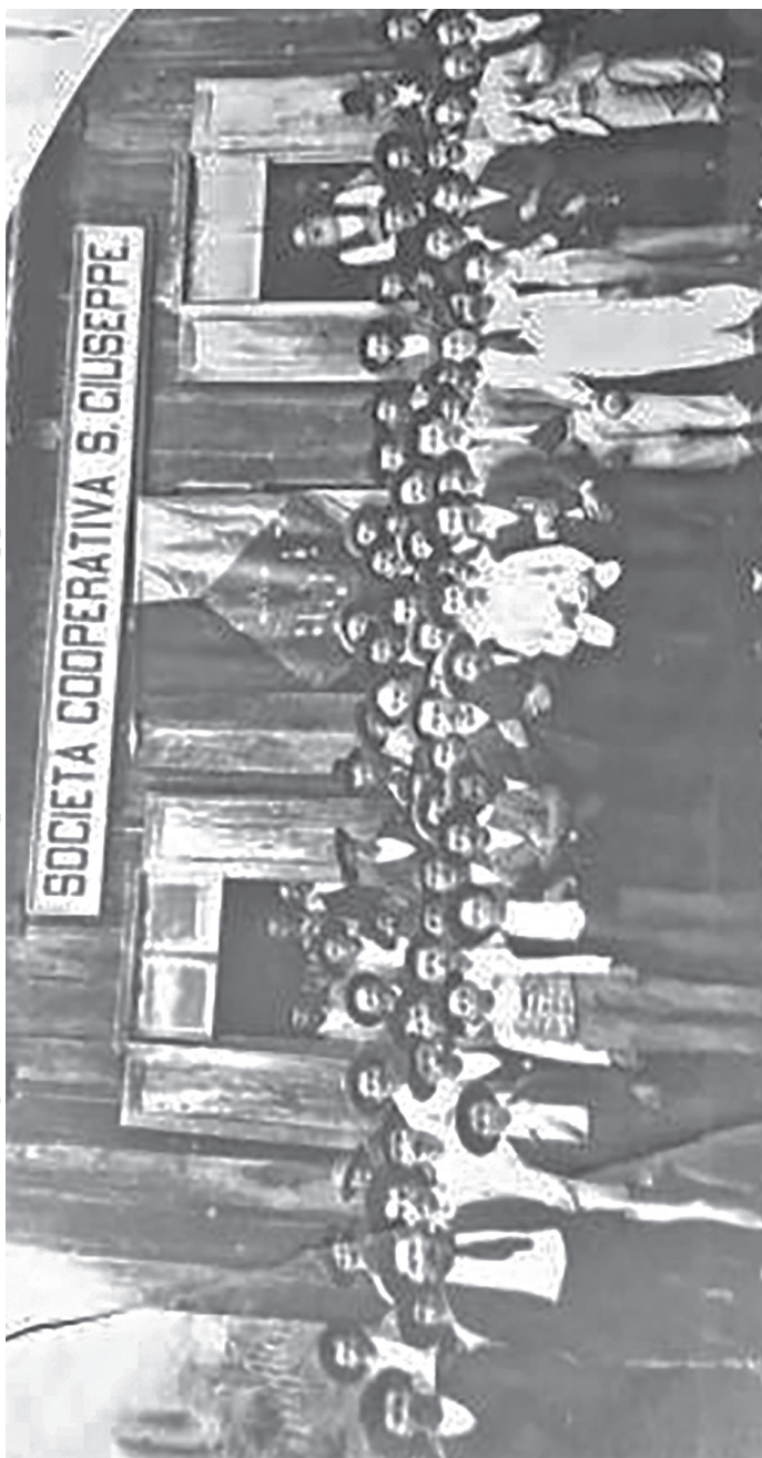
Figura 3 – Società Cooperativa San Giuseppe (Rodeio 50)